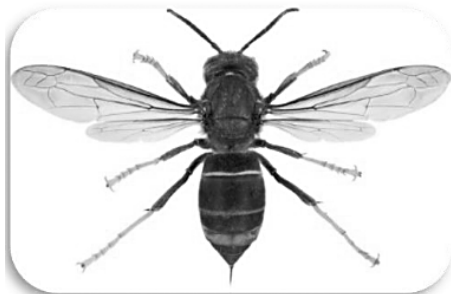
Asiatische Hornisse