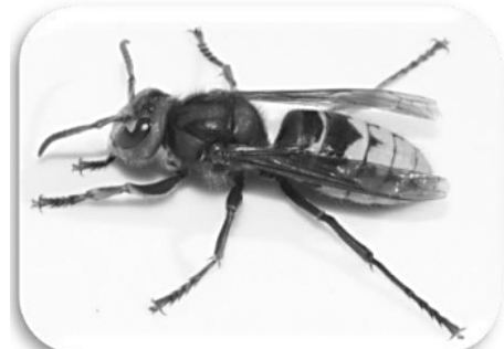
Europäische Hornisse